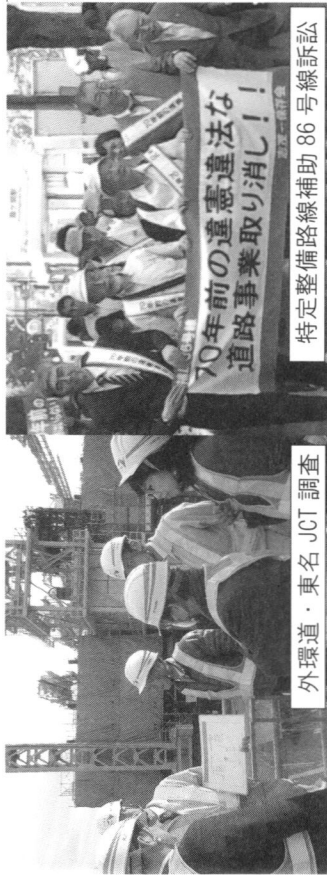
外環道・東名JCT調査