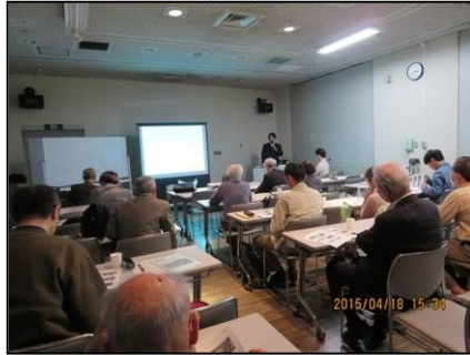
↑ 2015.04.18 「鉄道の未来」講演会（東京）